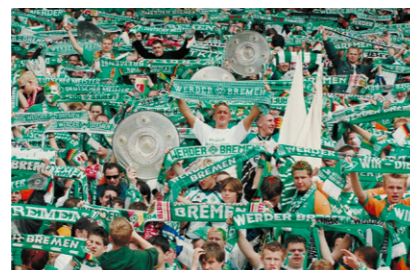
Die Werder Fans im Weserstadion