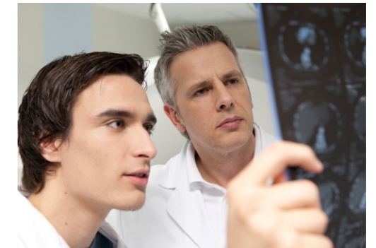
Intensive Betreuung von Experten – in Theorie und Praxis