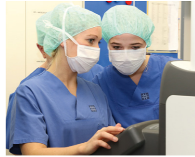
Als PJ'ler bei Operationen mit modernster Technik mitwirken