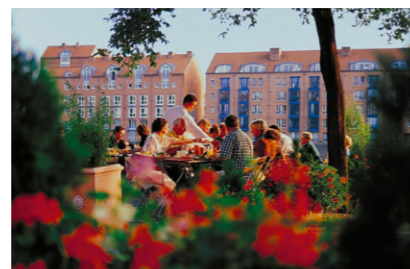
Ein Biergarten an der Schlachte

Hochschulen und Universität, aber auch die vielen internationalen Technologieunternehmen prägen das Stadtleben und sorgen für internationales Flair. Das Viertel, Bremens buntester und lebendigster Stadtteil, bietet Kneipen und Cafés jeder Art. Dort befinden sich mit dem Bremer Theater, der Kunsthalle, dem Wilhelm-Wagenfeld-Haus und zahlreichen weiteren Einrichtungen viele kulturelle Angebote. Wie die Stadt früher aussah, lässt sich im Schnoor, einem kleinen historischen Stadtteil, erahnen – oder aber auf dem Marktplatz mit dem Dom und dem beeindruckenden Rathaus. Ob Hafen oder Weserstrand, Bürgerpark oder edle Geschäfte in der Innenstadt, ob Überseemuseum oder Weserstadion: Bremen hat für jeden Geschmack etwas zu bieten. Nicht nur für PJ-Studierende.