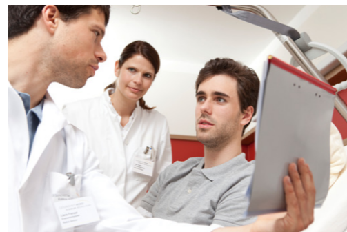
Erstellung von Diagnostik und Therapieplänen unter Aufsicht