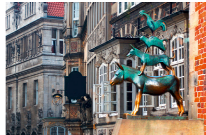
Die Bremer Stadtmusikanten

Bremen – eine moderne Stadt mit einem breiten kulturellen Angebot, stark in Wissenschaft und Technologie und mit großer maritimer Vergangenheit. Eine Stadt, die gerade für junge Menschen spannend und lebenswert ist. Um es auf den Punkt zu bringen: In Bremen lässt es sich leben.