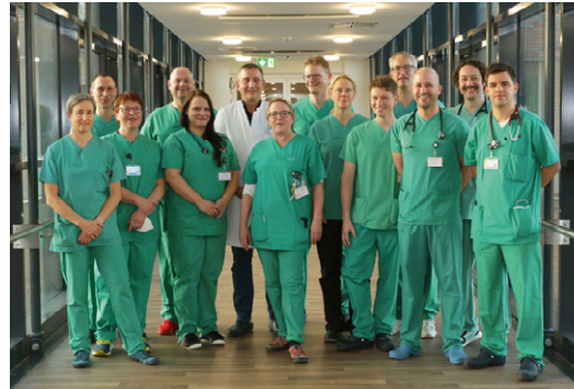
Unser ärztliches Leitungsteam