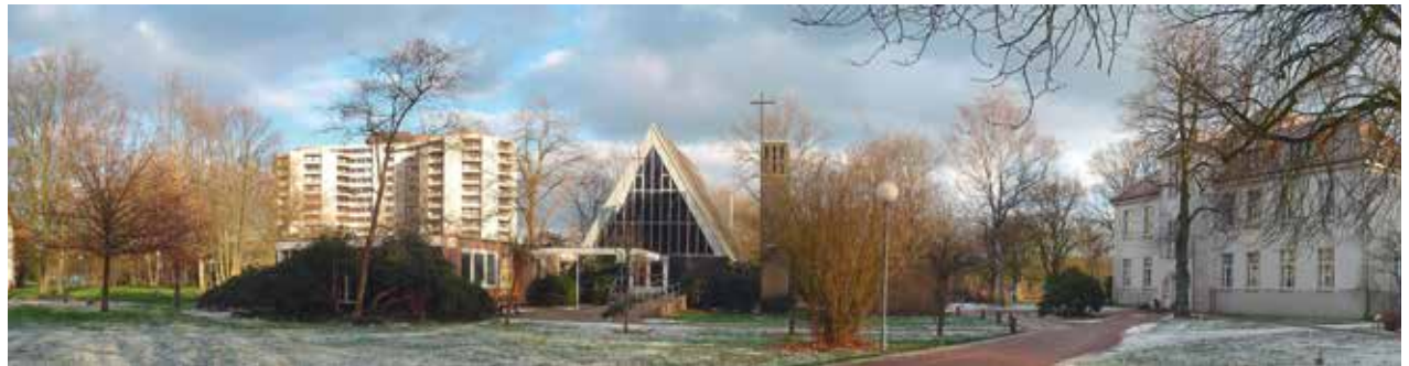
Kirche im Park