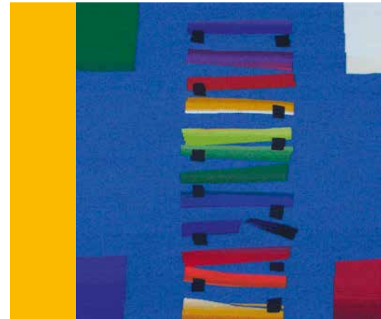
Altarbehang in der Kirche im Park